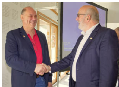
Saint Aubin, AG CNB40 24 mars 2024